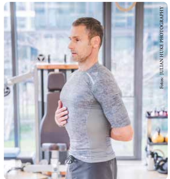
Abb. 3a und b: Atemtraining des Brustkorbs: Das notwendige Biofeedback geben die eigenen Hände.

Das Restvolumen in der Lunge nach normaler Ausatmung ist die funktionelle Residualkapazität, also eine Reserve der Lunge. Um diese zu testen, atmet man ohne vorherige Anstrengung und ohne zu